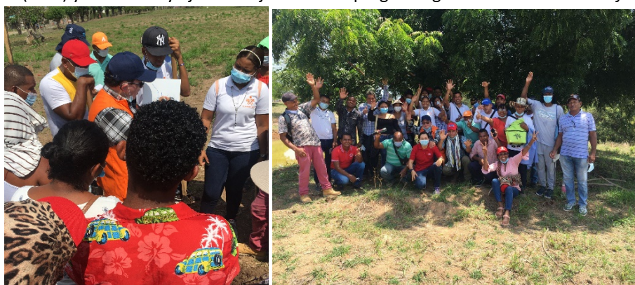
Figura 5: Taller manejo de cultivos con riego por reúso, San Antero, Col.

Por otro lado, se buscó ampliar el conocimiento de la población frente al reúso, dejando clara la diferencia entre el uso seguro de aguas tratadas y el uso de agua contaminada para el riego de cultivos. Esto se logró a través de la participación de los líderes y lideresas de asociaciones de pequeños agricultores, ganaderos, pescadores y mangleros en el taller de “Manejo integral de cultivos con riego por reúso de agua residual doméstica, enfocado en especies forestales y agrícolas”, en el cual se fortalecieron los conocimientos técnicos frente al manejo eficiente del agua en el riego de cultivos, técnicas de riego, tipos de cultivos, cuidado del suelo, beneficios del reúso, la importancia de esta nueva visión para la sostenibilidad ambiental, entre otros temas. Este acercamiento no solo permitió impartir conocimientos técnicos para el mejor desarrollo de sus labores diarias, sino que mejoró la aceptación e interés de la comunidad en el proyecto. Este taller fue financiado por el Ministerio Federal de Cooperación Económica y Desarrollo de Alemania (BMZ) y elaborado y ejecutado junto con el programa global de GIZ Sanitation for Millions .