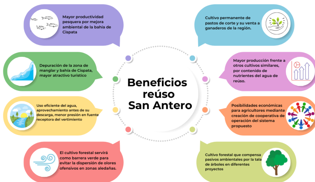
Figura 6: Beneficios del reúso de aguas residuales tratadas en San Antero, Col.

Para el caso específico de San Antero, y la implementación de la construcción, se tendrán múltiples beneficios, iniciando con el tratamiento adecuado de las aguas residuales del municipio, que permita el cumplimiento de la normatividad de vertimientos, la eliminación de malos olores y reduzca la contaminación de fuentes de agua, especialmente en la bahía de Cispatá mejorando la condición de vida de los pescadores y fomentando el turismo de la zona. En relación con el reúso se tendrá una producción de pastos de corte durante todo el año lo que beneficiará a los pequeños ganaderos al poder sostener su ganado durante todo el año y no tener pérdidas por su venta en verano cuando no se tiene suficiente pasto para alimentarlos. Adicionalmente, de manera comunitaria se puede gestionar el proyecto de reúso y producción de pastos de corte, para que pequeños agricultores lo perciban como una fuente adicional de ingresos, una mejora en la producción y un mayor compromiso de la empresa operadora para garantizar la calidad de agua necesaria en el riego. Estos son algunos de los beneficios que se podrían generar luego de la implementación del proyecto, demostrando que el reúso puede mejorar no solo el medio ambiente sino generar beneficios directos e indirectos a la población y a sus condiciones de vida como se expone a continuación: