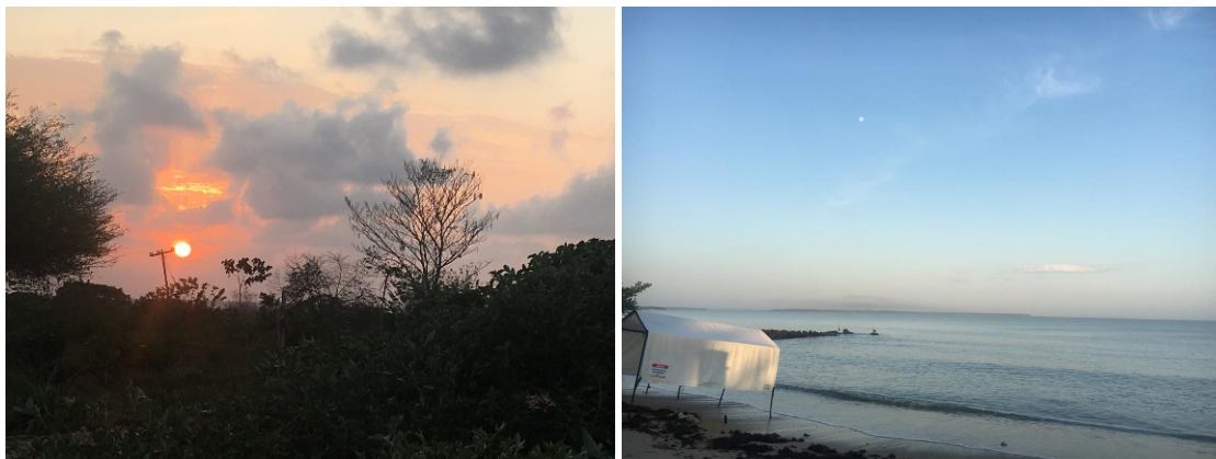
Figura 4: Imágenes de San Antero, Col.