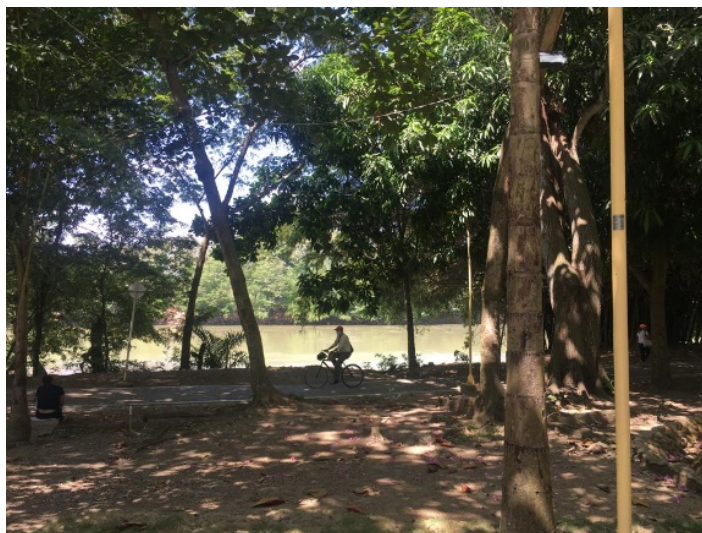
Figura 2: Malecón Río Sinú Col.

En Colombia, a pesar de contar con un gran número de normas reguladoras en materia de gestión integrada de aguas, aún no se han incluido en la práctica aspectos importantes como el reúso de aguas residuales tratadas. Debido a esta falta de inclusión, el país cuenta con poca experiencia en este ámbito. Las iniciativas relacionadas con la temática se han desarrollado de manera empírica, buscando suplir la necesidad urgente del recurso, pero, sin tener en cuenta temas de saneamiento, salubridad pública o las normas nacionales y locales que regulan el reúso seguro, disponibles desde el 2014.. La informalidad de los pocos ejemplos nacionales se ve reflejada en la ausencia de datos formales por parte de las entidades encargadas del control del recurso hídrico en el país. Esta situación se busca contrarrestar gracias a los esfuerzos del gobierno nacional, que, en su Estrategia Nacional de Economía Circular, ha priorizado dentro de los 6 flujos de materiales de gran importancia para el país el flujo del agua. Adicionalmente se han concentrado los esfuerzos en la reglamentación del reúso, mediante la actualización de la resolución 1207 de 2014 3 buscando mayor facilidad tanto para generadores del recurso como los posibles usuarios de tener acuerdos de reúso mediante una norma más flexible y con un menor número de requisitos: la resolución 1256 de 2021.