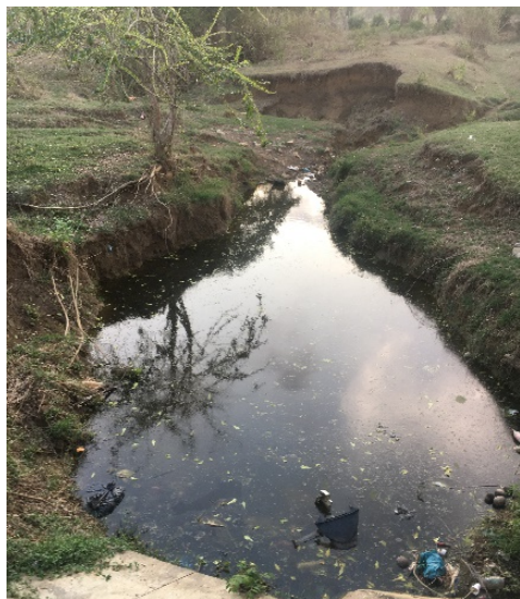
Figura 3: Caño El Lobo, San Antero, Col.

Lo anterior permite que estas prácticas sean replicadas en el territorio nacional y los beneficios sean entendidos por la población en general, teniendo en cuenta que al realizar un reúso seguro de aguas tratadas se reduce la presión a los recursos hídricos, aumentando la disponibilidad de agua para otros usos y evitando la descarga de nutrientes y altas cargas orgánicas que deterioran