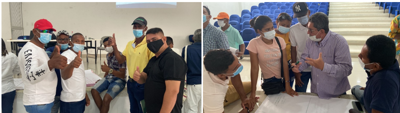
Figura 10: Participantes del taller manejo integral de cultivos con reúso de agua, San Antero, Col.

El proyecto ha tenido un enfoque participativo en el cual se da a conocer cada etapa del proceso con los resultados obtenidos, los riesgos identificados y las ideas a desarrollar en las etapas posteriores, para ello se ha involucrado al Ministerio de Ambiente y Desarrollo Sostenible, el Ministerio de Vivienda, la Comisión de Regulación de Agua Potable y Saneamiento Básico, la Alcaldía Municipal de San Antero, líderes de organizaciones comunitarias y población beneficiada.