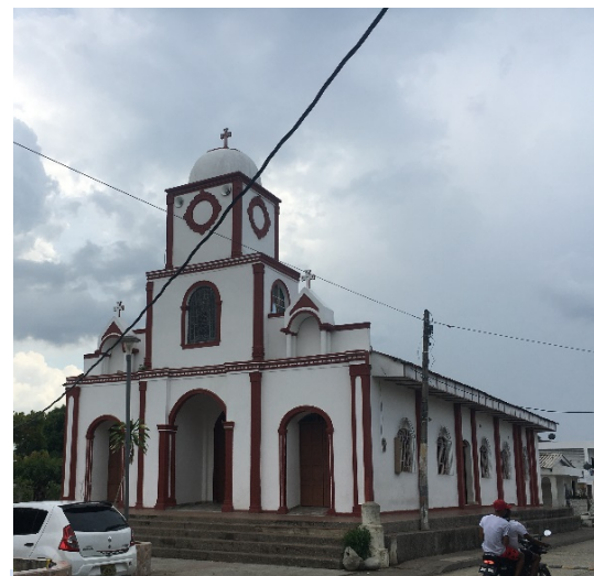
Figura 1: Iglesia San Antero, Col.

El proyecto piloto busca optimizar la infraestructura existente del sistema de tratamiento de aguas residuales domésticas municipales de San Antero. La cual está compuesta de tres lagunas de oxidación, que presentan problemas operativos y fallas de mantenimiento que impiden lograr la calidad necesaria para realizar un vertimiento acorde a la resolución 631 de 2015 1 . A través de estudios de prefactibilidad se identificaron los puntos que requieren mayor atención para lograr la operatividad del sistema, posteriormente se contrató una firma consultora encargada del diseño a detalle de la optimización de las lagunas y el diseño del sistema de reúso, con lo cual una parte del caudal tratado en las lagunas tendrá un tratamiento adicional para cumplir con los requisitos impuestos en la resolución 1256 de 2021 2 que reglamenta el reúso en el país, para usar el agua tratada en el riego de un