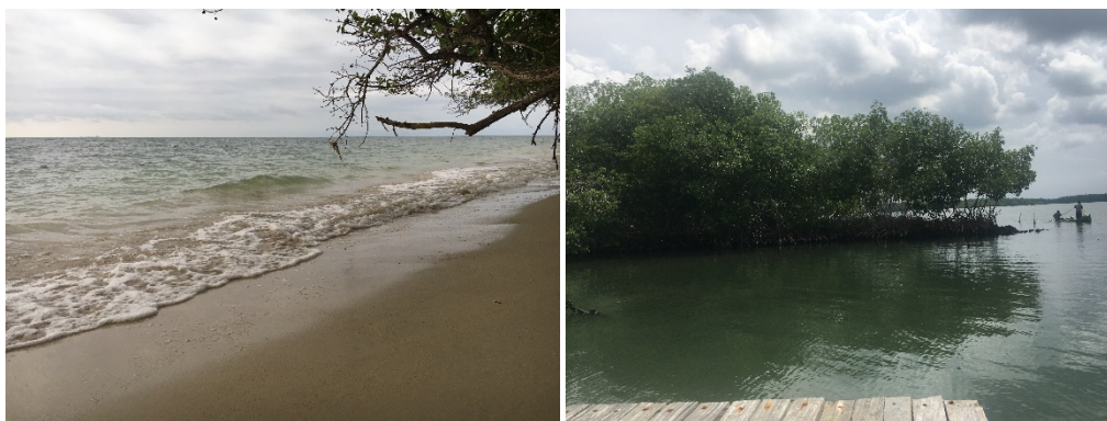
Figura 9: Ecosistemas locales que se beneficiarían del reúso, San Antero, Col.