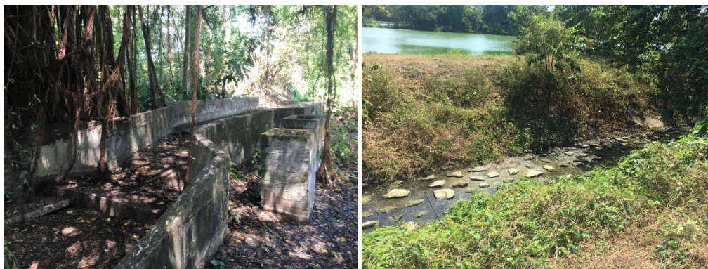
Figura 7: Infraestructura existente sistema de tratamiento de aguas residuales, San Antero, Col. / Fotografía: © GIZ/ Diana García

lotes para el pastoreo que implicaba impedir el paso del ganado al área irrigada por un periodo de tiempo, entre otras actividades. Al encontrar esta situación se optó por utilizar áreas aledañas al sistema de tratamiento que pertenecen al Municipio, estos terrenos cuentan con la titularidad necesaria para tramitar permisos, y facilitan la intervención, posteriormente se podría buscar otras maneras de vincular a las personas propietarias de terrenos cercanos en el proyecto en etapas posteriores.