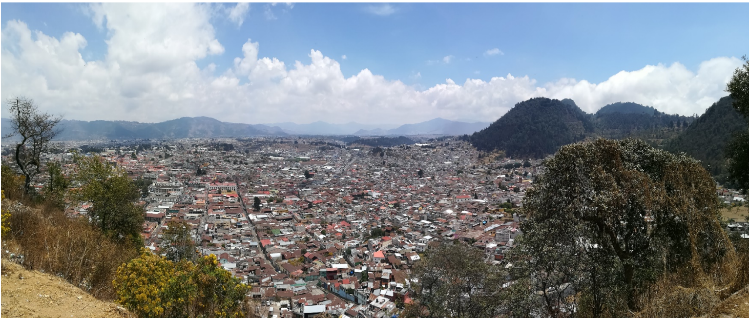
Figura 1: Valle de Quetzaltenango, Guatemala.

Gobernanza territorial con enfoque de cuencas en Guatemala: Guía para la elaboración de planes de manejo de microcuencas y fortalecimiento de capacidades