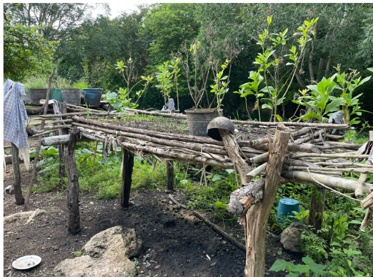
Figura 2: Kanché en San Antonio Segundo. El kanché es un método tradicional maya para la siembra de hortalizas.

Además, hubo una disparidad alta entre su grado de uso entre las comunidades beneficiadas. Por ejemplo, en la comunidad de Tres Reyes todas las ecotecnologías instaladas han sido empleadas efectivamente mientras que todas las implementadas en Mulichén fueron abandonadas. De este modo surge la necesidad de plantear soluciones personalizadas desarrolladas a través de un enfoque participativo con la comunidad.