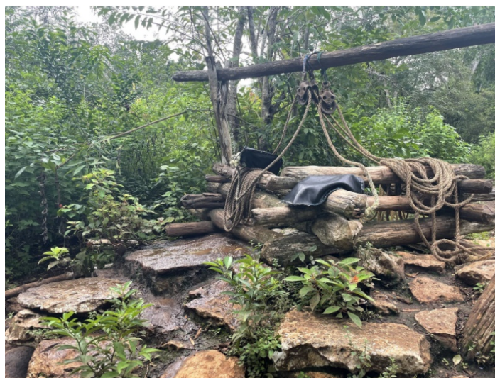
Figura 1: Pozo comunitario en mal estado para abastecimiento de agua en una comunidad de Quintana Roo.

Entre los componentes del GEF CReW+ se incluye la creación de soluciones tecnológicas, innovadoras, a pequeña escala (local, rural, periurbana y comunitaria) para la Gestión Integrada de Agua y Aguas Residuales. En este documento se comparten buenas prácticas en el diagnóstico de